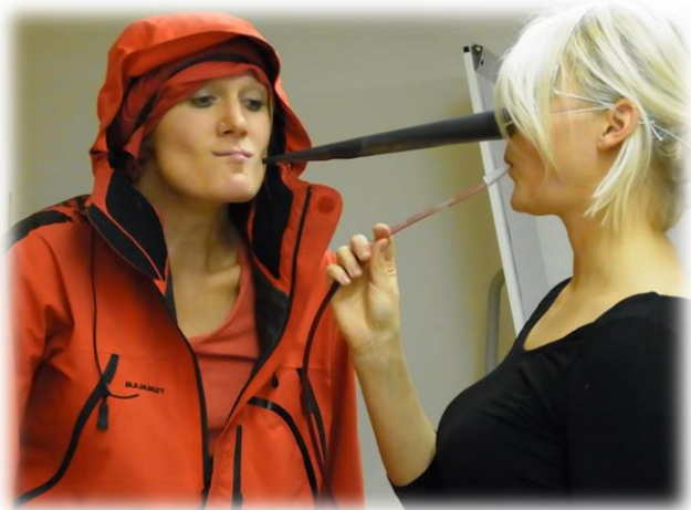
Moskito saugt Blut