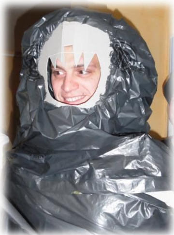
So sieht ein Wurm aus