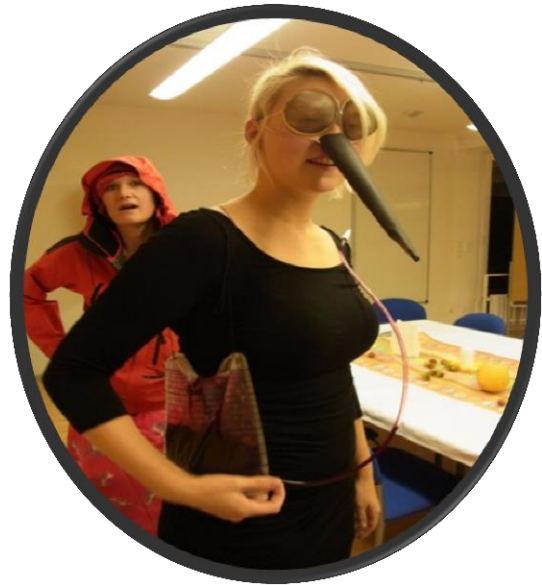
Nach getaner Arbeit..